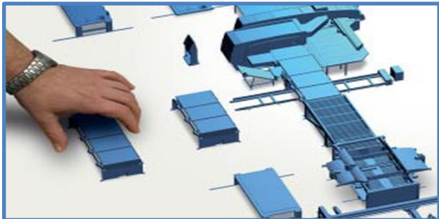
Модернизация производства товаров (работ, услуг)