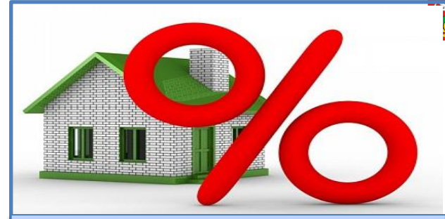
Проценты по кредитам